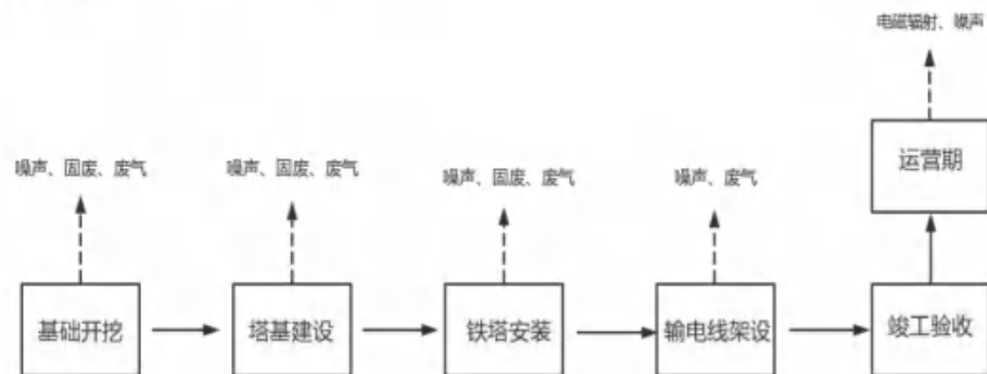
图 2-3 输电线路施工工艺及产污环节图